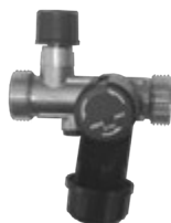
Ду 15 мм

Обязательно устанавливается на патрубке ввода холодной воды до отсекающей арматуры. Защищает ёмкость от повреждений при расширении нагреваемой воды. В состав группы безопасности входит: обратный клапан, предохранительный клапан (6 бар или 8 бар), отсекающий клапан, сливная воронка, посадочное место для манометра 3/8".