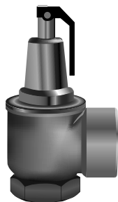
Ду 32 ...50 мм