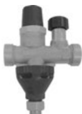
Ду 20 мм

Обязательно устанавливается на патрубке ввода холодной воды до отсекающей арматуры. Защищает ёмкость от повреждений при расширении нагреваемой воды. В состав группы безопасности входит: обратный клапан, предохранительный клапан (6 бар или 8 бар), отсекающий клапан, сливная воронка, посадочное место для манометра 3/8".